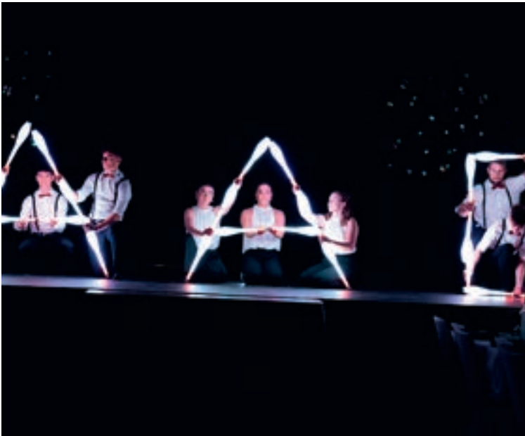
In jedem Sinne ein Leuchten!

Das Jubiläumsvarieté im Stadtsaal Kaufbeuren im November 2025 war ein besonderer Moment im Vereinsjahr und zugleich ein sichtbares Zeichen für 25 Jahre Artistica Anam Cara. An fünf Veranstaltungstagen wurde jeweils ein rund dreistündiges Programm gezeigt, das Bewährtes mit neuen Elementen verband. Neben klassischen Jonglage- und Akrobatikeinlagen kamen erstmals auch Formate wie LED-Jonglage und LED-Poi zum Einsatz. Diese wurden durch eine entsprechende Förderung erst möglich. Luftakrobatik ergänzte das Programm und verlieh dem Abend zusätzliche Facetten. Mit etwa 100 Aktiven im Alter von 8 bis 50 Jahren stand eine ungewöhnlich breite Gruppe gemein-