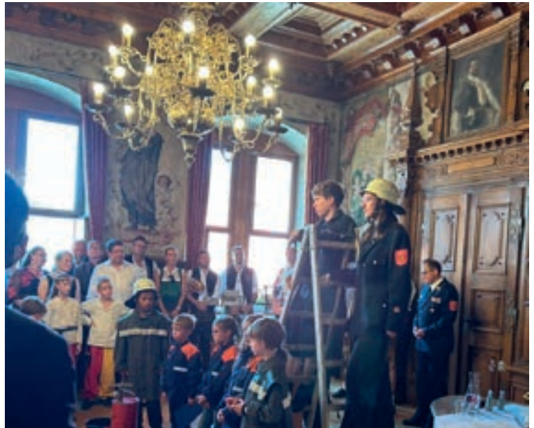
Spielszene beim OB Empfang im alten Sitzungssaal „Thema Stadtbrand“

Dazu gehören insbesondere die großen Sprech- und Spielrollen vor dem Rathaus. Die Darstellerinnen und Darsteller von Kaiser Maximilian, Kunz von der Rosen, Bürgermeister, Kanzler, Ratsherren, Kaiserin, Herzogin und Hofdamen werden intensiv vorbereitet. Viele Einzel-, Gesamt- sowie Stellproben sind hierfür notwendig, um einen reibungslosen Ablauf und eine überzeugende Darstellung zu gewährleisten. Es ist eine besondere Ehre, diese historischen Figuren darstellen zu dürfen, aber es ist auch ein enormer Druck. Wenn alle Kirchenglocken der Stadt läuten, während man mit dem Pferd vor das Rathaus zieht, der Bürgermeister einen am Rathaus empfängt und dazu alle Zuschauenden auf den Sitztribünen aufstehen, dann hüpfet einem schon das Herz dann bis zum Hals. Hier wird klar, wie wichtig eine gute Vorbereitung ist. Ebenso wird die Rolle des Zunftmeisters einstudiert, der den Häfelesmarkt des Tänzelfestes eröffnet.