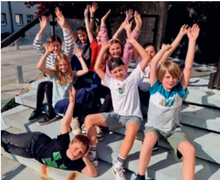
Kinder in der Gruppenstunde

Die Gruppenarbeit der Kulturwerkstatt bildet das Herzstück der theaterpädagogischen Arbeit. Insgesamt elf Gruppen treffen sich regelmäßig zu ihren wöchentlichen Gruppenstunden. Die Kinder und Jugendlichen sind alle im Alter zwischen 6 und ca.20 Jahren. Ergänzt wird das Angebot durch eine Inklusionsgruppe, die Gauklergruppe Compania Giocolari , unser langjähriges Erwachsenenensemble und eine noch neugebildete Gruppe von jungen Erwachsenen, die bereits als Kinder/Jugendliche Mitglieder der Kulturwerkstatt waren.