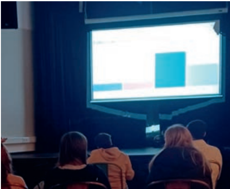
Kahoot-Quiz in der Disco

Ein zentrales Element war der Einsatz interaktiver Lernformate wie Kahoot. Durch Quizformate zu Themen wie Jugendkultur – beispielsweise Liederraten aus unterschiedlichen Musikgenres –,