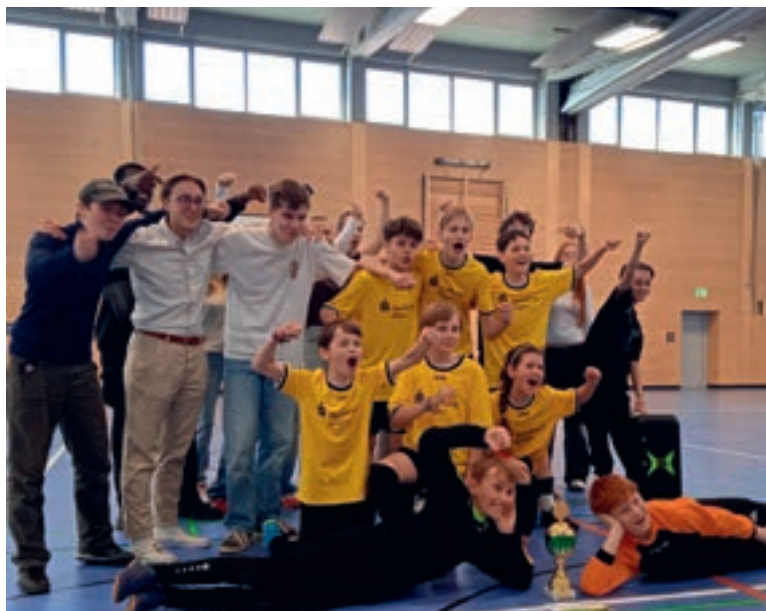
Anpacken, gestalten, bewegen – Die AJG St. Dionysius bei der 72-Stunden-Aktion

Der Bistumscup der Ministrantinnen und Ministranten fand dieses Mal in Kaufbeuren statt und zeigte eindrucksvoll, welche Bedeutung das gemeinsame Erleben für die Jugendarbeit hat. Über den Tag hinweg kamen zahlreiche junge Menschen unterschiedlicher Altersgruppen zusammen, um sich im sportlichen Wettbewerb zu messen, Neues auszuprobieren und als Team zusammenzuwachsen. Auf dem Spielfeld standen Einsatz, Fairness und das Miteinander im Vordergrund, während abseits davon Zeit für Begegnung, Austausch und gemeinsames Erleben blieb. Gerade die Mi-