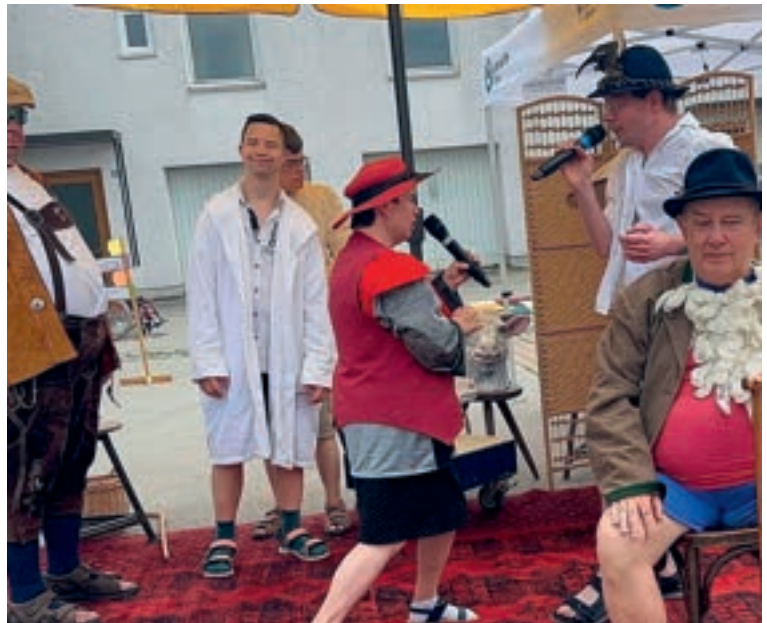
„Heidi“ – Auftritt der Blauen Paprika beim Sommerfest der Lebenshilfe

Zukünftig möchten wir verstärkt jüngere Menschen mit Beeinträchtigungen ansprechen und in bestehende Gruppen mit aufnehmen. Unser Ziel bleibt es, Inklusion als gelebten Alltag weiterzuentwickeln und allen Teilnehmenden gleichermaßen Raum zur Entfaltung zu bieten. Menschen mit Beeinträchtigungen bringen dabei nicht nur Vielfalt in unsere Arbeit, sondern auch viel gute Laune, Offenheit und Ehrlichkeit. Sie sind ein wertvolles Spiegelbild für uns alle und bereichern die Kulturwerkstatt auf ganz besondere Art und Weise.