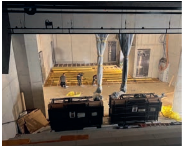
Der neue Theatersaal der Kulturwerkstatt

Ein weiterer wichtiger Bestandteil ist der neue Inklusionsbetrieb der Lebenshilfe Ostallgäu im Eingangsbereich. Hier werden künftig Menschen mit und ohne Beeinträchtigung gemeinsam arbeiten und den offenen Charakter der Kulturwerkstatt stärken. Nach den baulichen Fortschritten lag der Fokus auf der Fertigstellung des Projekts. Dabei spielten neben den Bauarbeiten vor allem organisatorische Aufgaben eine zentrale Rolle. Das Team der KW war intensiv in Planungen, Abstimmungen und zahlreichen Besprechungen eingebunden. Gemeinsam mit dem Architekturbüro Stadtmüller Burkhardt Graf, insbesondere mit unserem zuständigen Architekten Jonas Hahn, wurden