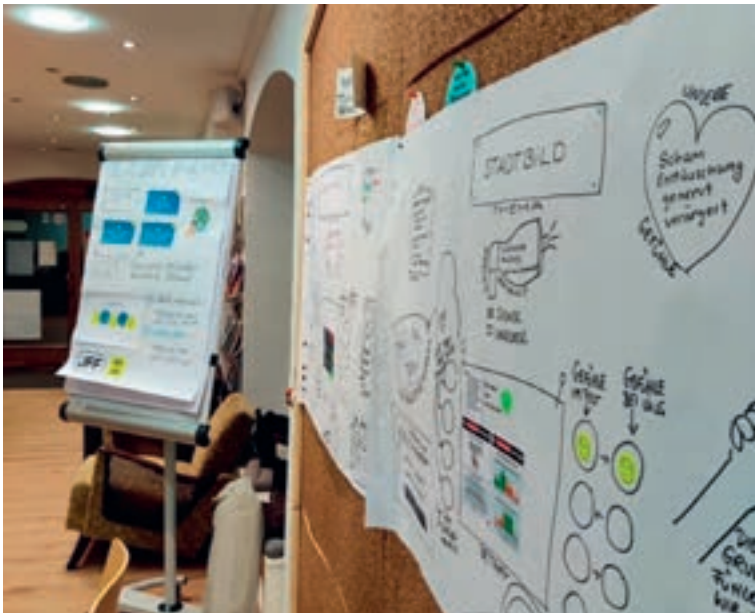
Zwischenergebnisse aus dem Workshop wurden am Flipchart und Plakaten festgehalten

ob Inhalte vertrauenswürdig sind. Ebenso wurde thematisiert, in welchen Situationen sie ihre Meinung äußern und wann sie sich bewusst zurückhalten. Der Workshop war Teil eines größeren Forschungs- und Beteiligungsprojekts, das darauf abzielt, die Perspektiven junger Menschen sichtbar zu machen und besser zu verstehen, was sie in einer von Unsicherheiten und digitalen Herausforderungen geprägten Zeit bewegt. Die offenen Gesprächsrunden boten Raum für persönliche Erfahrungen und unterschiedliche Sichtweisen, die im weiteren Verlauf dokumentiert und wissenschaftlich ausgewertet werden. Die Ergebnisse fließen in die qualitative Forschung des JFF ein und sollen Impulse für die medienpädagogische Arbeit und die Weiterentwicklung von Beteiligungsformaten zu geben.