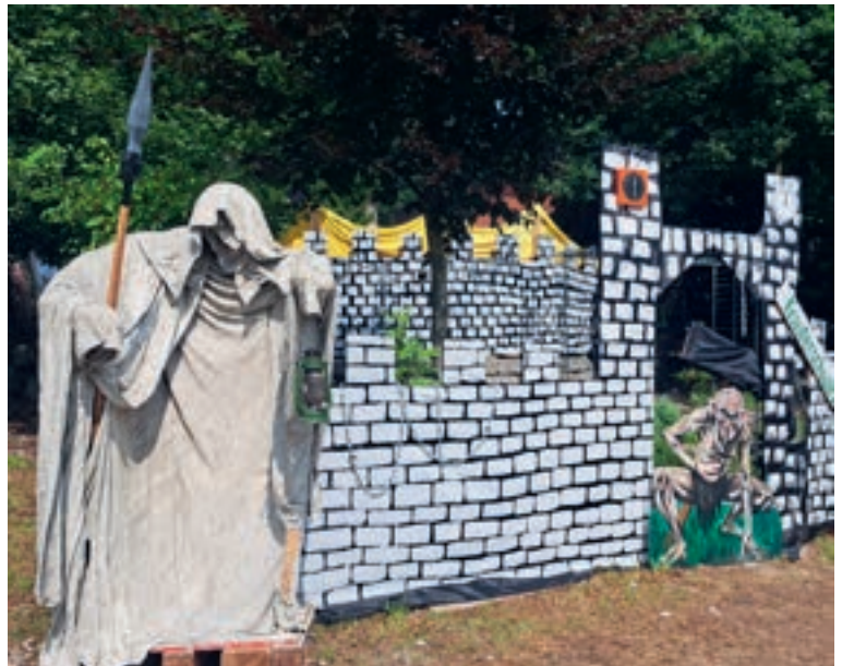
Gut bewacht! Die Steingeister passen auf Kinder und Wesen Nacht auf.

schleusen WEIT geöffnet waren, ließ sich davon niemand ins Boxhorn jagen oder gar die Laune verderben. Kinder und Betreuer:innen-Team sind gespannt, wo die Reise 2026 hingehen wird. Ein leises S.O.S. ist zu vernehmen.