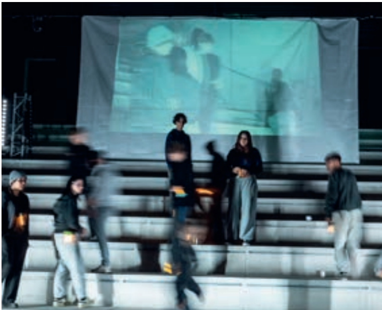
„Tribunal“ gespielt von der Oberstufe, in der noch nicht fertiggestellten Kulturwerkstatt

Mit dem Theaterstück „Tribunal“ brachte die Oberstufe der Kulturwerkstatt ein beklemmendes und aktuelles Zukunftsszenario auf die Bühne. Das Stück von Dawn King, in der deutschen Fassung von Henning Bochard, feierte am 27. September 2025 Premiere und entfaltete unter der Regie von Thomas Garmatsch und Jannis Konrad eine eindringliche Wirkung. Die Handlung zeigt eine Gesellschaft im Ausnahmezustand: Vor einem gnadenlosen Gericht müssen Angeklagte beweisen, dass sie für das Überleben der Gemeinschaft nützlich sind. Wer scheitert, verschwindet für immer. Wahrheit und Lüge, Opfer und Täter - die Grenzen verschwimmen. Das Publikum wird unweigerlich mit der Frage konfrontiert: Welches Urteil würden Sie fällen?