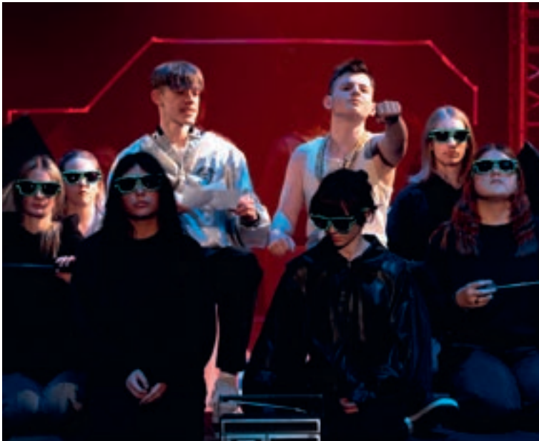
Roadmovie „Tschick“

Viele Wochen der Auseinandersetzung mit dem Text, des Probens, die Weiterentwicklung der Rollen, des Zusammenwachsens des Ensembles und des sich persönlich Weiterentwickelns lagen dann am 15. März 2025 hinter uns. Die Jugendlichen der Kulturwerkstatt brachten bei den Aufführungen