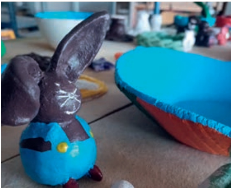
Töpferwerke der OBA

Auch im Jahr 2025 wurde die langjährige Zusammenarbeit zwischen dem Jugendzentrum Neugablonz und der Offenen Behindertenarbeit erfolgreich fortgeführt. Dadurch konnten wieder mehrere inklusive Veranstaltungen im Jugendzentrum stattfinden. Dazu gehörten beispielsweise gemeinsame Töpferaktionen, das gemeinsame Essen von Pizza und Getränken im Offenen Betrieb sowie ein Disco-Abend. Diese Angebote schufen einen Ort der Begegnung, an dem sich Menschen mit unterschiedlichen Hintergründen kennenlernen konnten. Die Zusammenarbeit orientiert sich an