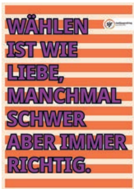
Eines unserer Aktionsplakate zur Bundestagswahl 2025

Im Vorfeld der Bundestagswahl nahm die U18-Wahl vorgezogener Maßen einen zentralen Platz in unserer Arbeit ein. Sie wurde an mehreren Schulen und in unseren Einrichtungen umgesetzt. In Zusammenarbeit mit engagierten Lehrkräften gelang es uns, zahlreiche junge Menschen zu erreichen und ihre Perspektiven auf Bundespolitik einzubeziehen. Neben der organisatorischen Durchführung der Wahl selbst lag ein besonderer Schwerpunkt auf Gesprächen im öffentlichen Raum. Dabei ging es weniger um konkrete politische Positionen als vielmehr um die Frage, was junge Menschen