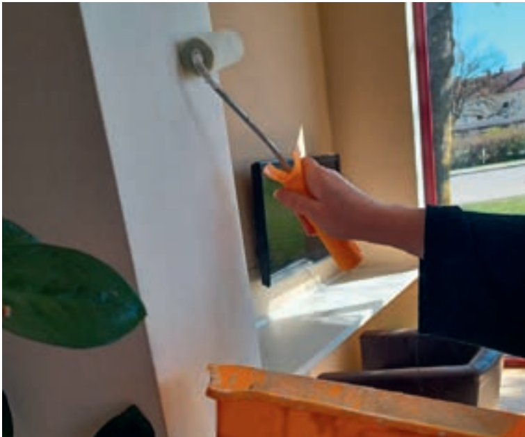
Jugendliche beim Streichen

Im vergangenen Jahr wurde im Jugendzentrum Neugablonz ein besonderes Projekt realisiert, das praktische und pädagogische Ziele verband. Während der Sommerferien nutzten Mitarbeitende und Jugendliche die ruhige Zeit gemeinsam, um ausgewählte Bereiche des Jugendzentrums zu renovieren. Dabei standen neben Verschönerungsmaßnahmen vor allem die aktive Mitgestaltung durch die Jugendlichen selbst im Vordergrund. Sie brachten eigene Ideen ein, halfen bei der Umsetzung und konnten ihre Fähigkeiten in unterschiedlichen handwerklichen Tätigkeiten erproben.