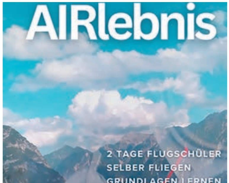
Abheben beim AIRlebnis

Mit dem sogenannten AIRlebnis wurde ein neues Angebot umgesetzt, das vor allem jungen Menschen einen unkomplizierten Zugang zum Luftsport ermöglichte. An einem Wochenende konnten Interessierte selbst in die Rolle von Flugschülerinnen und Flugschülern schlüpfen und erste Erfahrungen im Segelflug sammeln. Dabei stand nicht nur die Faszination des Fliegens im Mittelpunkt – das Gefühl des Abhebens, die Perspektive aus der Luft und die besondere Ruhe im Flug –, sondern auch das Vereinsleben am Boden. Das gemeinsame Vorbereiten, Warten und Helfen sowie das anschließende Zusammensitzen beim Essen und Grillen vermitteln einen authentischen Eindruck davon, wie stark der Luftsport vom Miteinander lebt. Begleitet von erfahrenen Mitgliedern entstanden so viele eindrucksvolle Momente, die auch in den Aftermovies auf der Homepage des Luftsportvereins sichtbar werden. Sie vermitteln einen stimmigen Einblick von der Verbindung aus Erlebnis, Gemeinschaft und ehrenamtlichem Engagement. Gleichzeitig zeigt sich, dass solche offenen Formate dazu beitragen können, Berührungspunkte abzubauen und neue Zugänge zur Jugendarbeit zu schaffen. Das AIRlebnis macht damit deutlich, dass niedrigschwellige Angebote nicht nur Interesse wecken, sondern auch erste Anknüpfungspunkte für eine längerfristige Beteiligung bieten können.