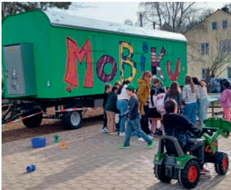
Das MoBiKu an der Schraderschule

Das Spielmobil „MoBiKu“ des Stadtjugendrings Kaufbeuren war auch im vergangenen Jahr ein wichtiger Bestandteil der offenen Kinder- und Jugendarbeit im Stadtgebiet. Von Montag bis Freitag ist es in verschiedenen Stadtteilen im Einsatz und bietet kostenfreie, niedrighschwellige Freizeitangebote. Die Öffnungszeiten orientieren sich an den Jahreszeiten: Von November bis Ende April ist es jeweils von 14:30 bis 17:30 Uhr geöffnet, von Mai bis Ende Oktober von 15:00 bis 18:00 Uhr. Ein besonderer Schwerpunkt lag 2025 im Projekt „Kleine Füße, große Spuren Vol. 2“, das sich mit den Themen