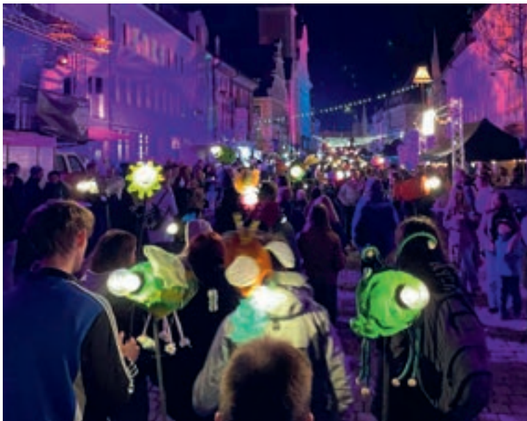
Lichterumzug beim Altstadtfunkeln

Auch wenn 2025 der Um- bzw. Neubau der Kulturwerkstatt im Vordergrund stand, so war die offene Kinder- und Jugendarbeit im vergangenen Jahr dennoch erneut geprägt von einem hohen Maß an Engagement, Kreativität und Gemeinschaftssinn. Zahlreiche Kinder und Jugendliche brachten sich mit viel Begeisterung in unterschiedliche große und kleine Projekte ein und präsentierten ihre Arbeit immer wieder öffentlich. Dabei standen neben der künstlerischen und kulturellen Bildung auch das gemeinsame Erleben, Mitgestalten und das Übernehmen von Verantwortung im Mittelpunkt.