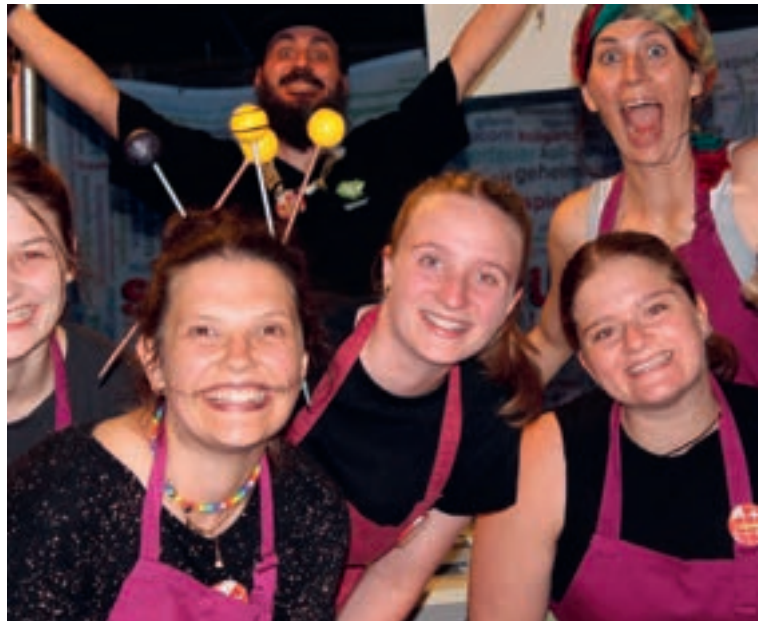
Für die „lieben Kleinen“ – stellen sich Betreuerinnen und Betreuer bei der Nacht hinter den Grill

Und von wegen Angst vor Gespenstern! Mit denen war es ziemlich lustig. Am letzten Tag ist die Trauer groß, dass es schon vorbei ist. Eins ist jetzt schon sicher: 2026 ist sie wieder mit dabei - dann auch in der ersten Woche!